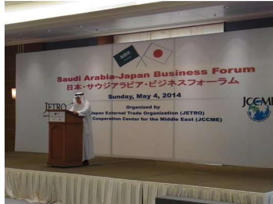
アブドラフマン・アル・ビン・ザーミル サウジアラビア商工会議所連盟会頭のご挨拶