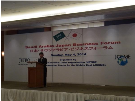
茂木経済産業大臣のご挨拶