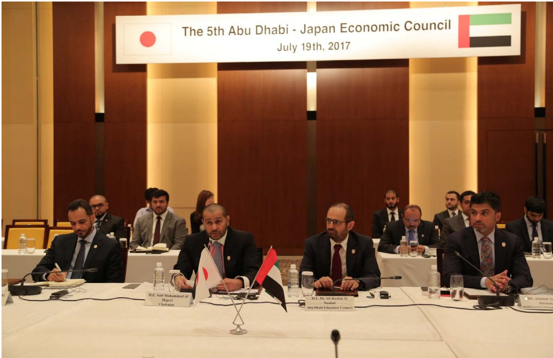
アブダビ側出席者