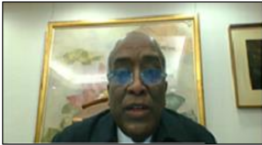
駐日エジプト・アラブ共和国大使館 特命全権大使 モハメド・アバカル・サレー・ファターフ閣下