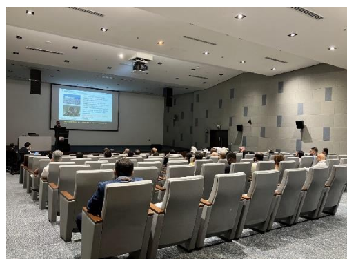
PWA-Ashghal 下水の効率運営に関する 現地技術ワークショップ②