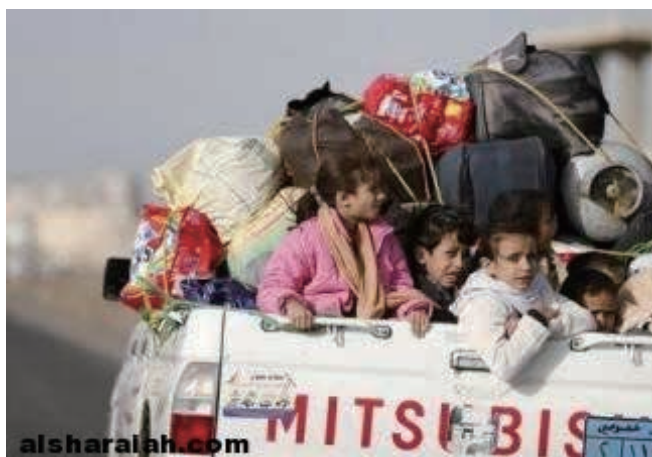
写真3 空爆を避ける国内避難民

http://ichef.bbc.co.uk/news/624/cpsprodpb/D65F/production/_85097845_5e3a5c2e-cf06-4808-ab57-5f5ca9175fad.jpg