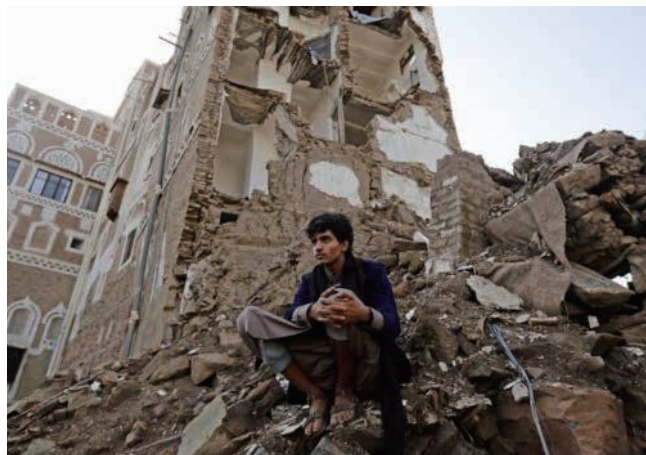
写真2 世界遺産であるサナア旧市街にも被害

http://ichef-1.bbc.co.uk/news/660/cpsprodpb/A62D/production/_91914524_1f324077-3512-4d8a-a7d4-516a434895b0.jpg