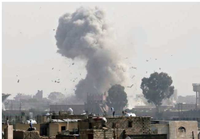
写真1 2015年サナア空爆

http://ichef-1.bbc.co.uk/news/660/cpsprodpb/A62D/production/_91914524_1f324077-3512-4d8a-a7d4-516a434895b0.jpg