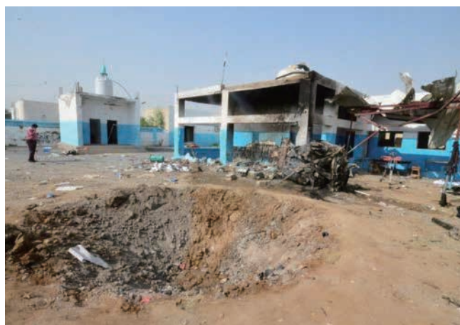
写真4 2016年8月の空爆で19人が死亡した