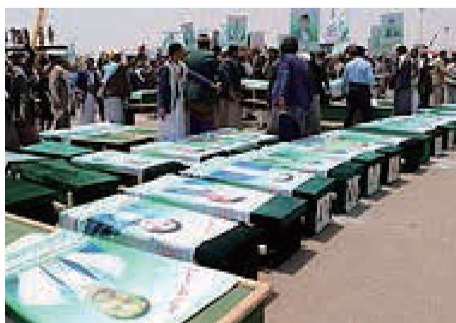
写真6 2018年8月のサアダでの誤爆により

http://ichef.bbc.co.uk/news/624/cpsprodpb/7949/production/_91894013_035799318.jpg